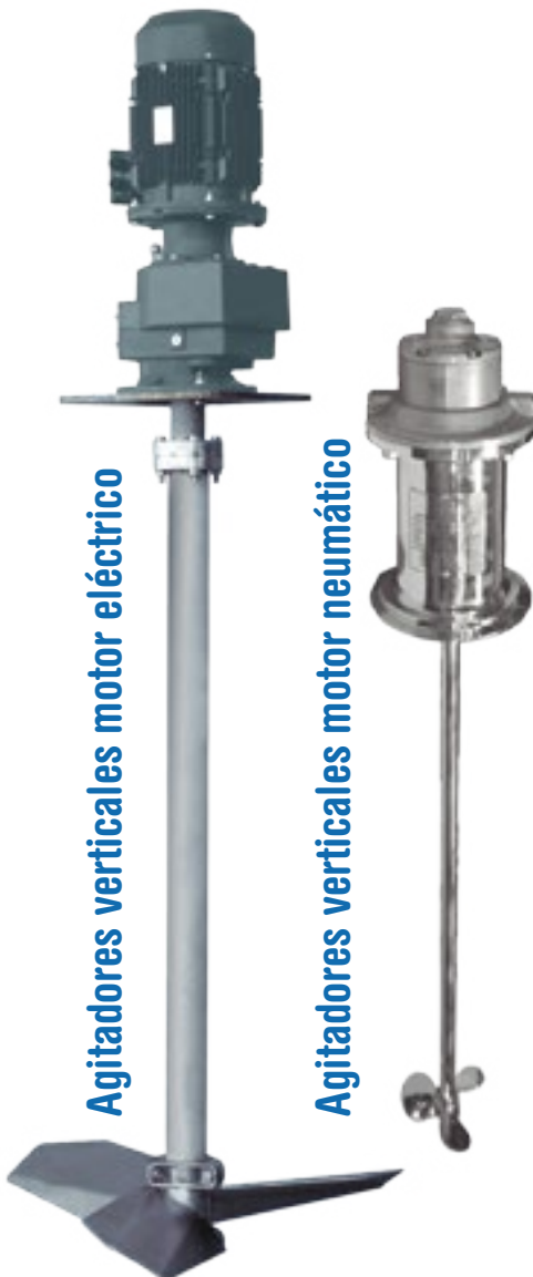
Agitadores verticales motor eléctrico